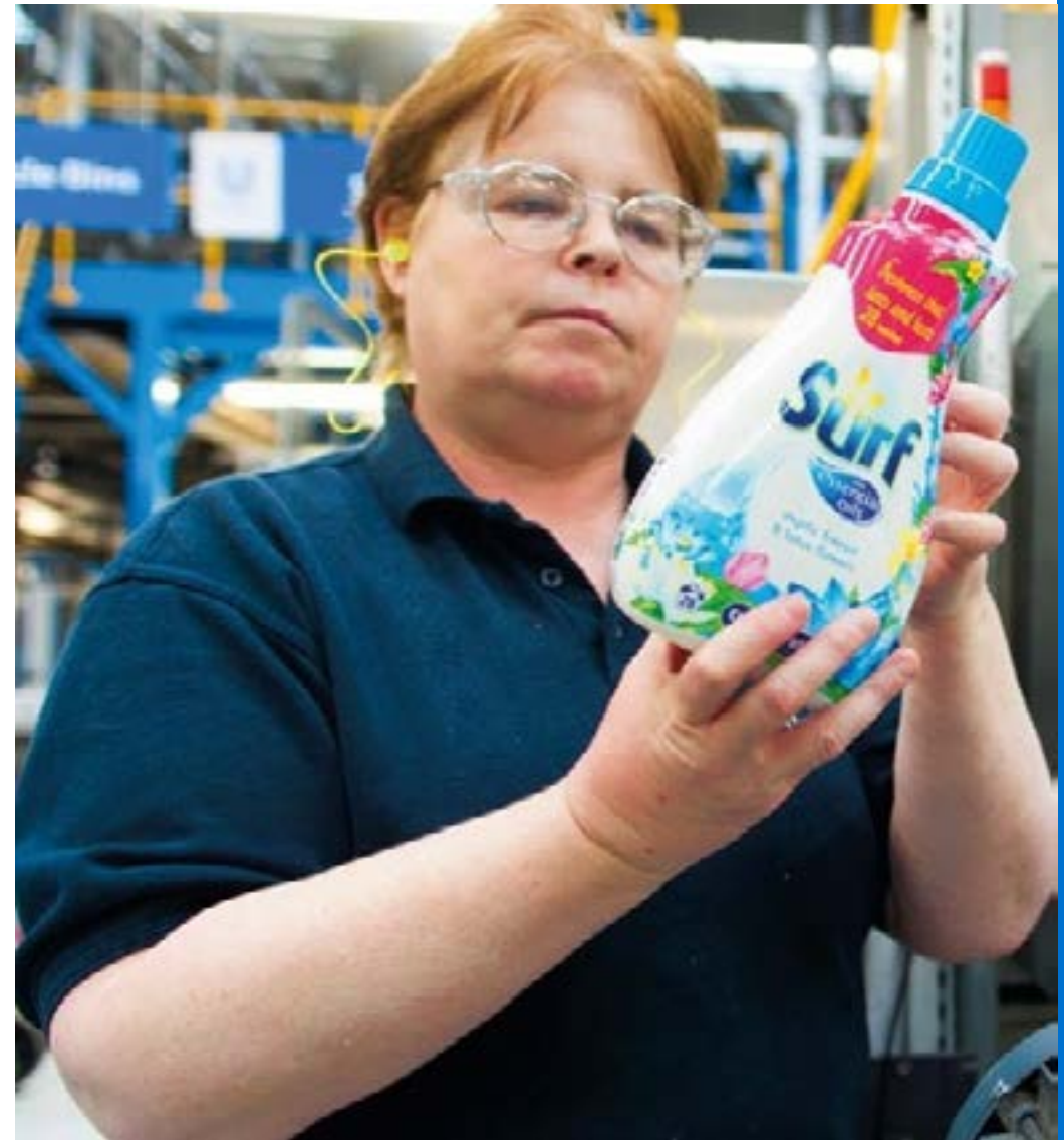
קוד העקרונות העסקיים והמידעיות בנוגע לקוד

יוניליוור תבצע מעת לעת, ובמועד המתאים, חוזרות מוצרים או השבתת שירותים שאינם עומדים בסטנדרטים הגבוהים שלנו או אלו שנקבעו בשוק.